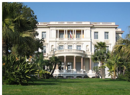
► Réception de bienvenue à la Villa Masséna