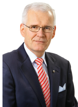
Asmo Kalpala El presidente

Hace unas semanas, la Comisión Europea publicó el muy completo “Análisis de la situación actual y perspectivas de las mutuas en Europa”. Invito a todos los lectores a descargarse este documento del sitio web de AMICE, a leerlo y, luego, a comentar a nivel local y con los demás miembros de AMICE su opinión acerca de las valiosas observaciones y conclusiones que incluye dicho análisis.