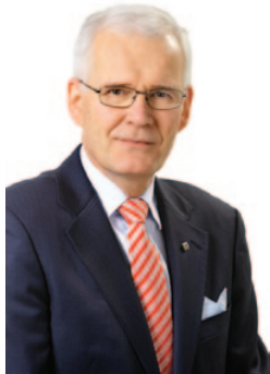
Asmo Kalpala El presidente

2010 ha sido un año muy completo para el sector del seguro y para nuestra asociación. Se celebraron debates importantes en muchas áreas claves, y defender nuestros intereses fue una tarea muy exigente. Gracias al esfuerzo incesante de AMICE y sus miembros, el trabajo ha obtenido sus frutos.